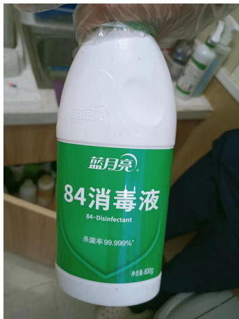
项目使用的消毒液