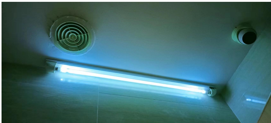
项目已安装紫外消毒灯管