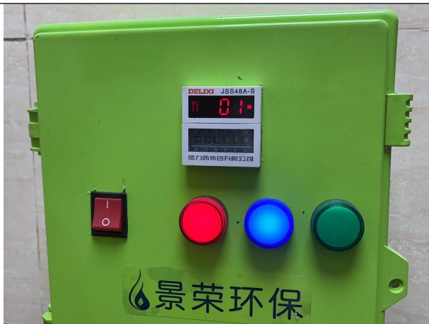
项目已安装医疗废水处理设施（处置室）