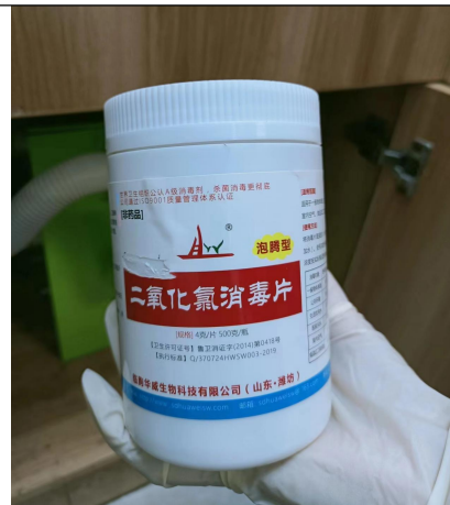
项目使用的二氧化氯消毒片