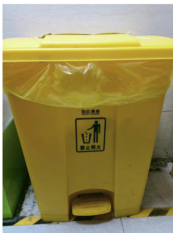
医疗废物暂存垃圾桶照片

本项目设有利器盒，产生的损伤性医疗废物单独收集、暂存在利器盒中；其他医疗废物采用防渗漏医疗垃圾收集袋分类收集并喷洒消毒液后，且定期清理废水处理池的沉渣，在项目设置的医疗废物暂存桶中密闭暂存，本项目设置 1 个医废暂存桶，桶容积为 45L。产生的所有医疗废物委托深圳市益盛环保技术有限公司拉运处理处置，医疗废物处理协议见附件 4。项目设置的医疗废物暂存垃圾桶及利器盒照片见图 3-5。