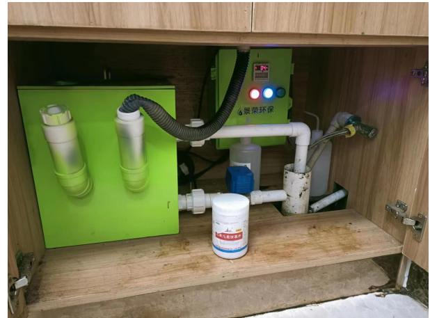
项目已安装医疗废水处理设施（手术室）