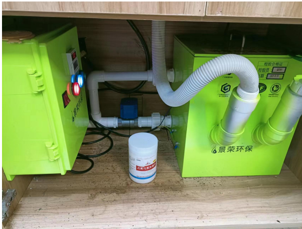
项目已安装医疗废水处理设施（化验室）